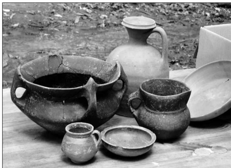
Посуда III-IV веков нашей эры

Управление информационной политики Мининформ РК