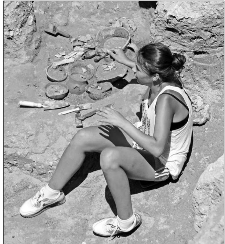
Находки археологического сезона 2015 года