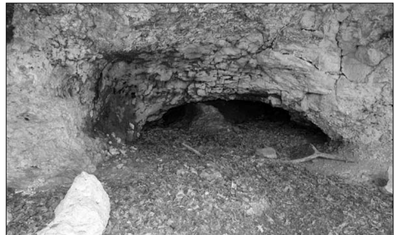
Стоянка среднего палеолита — пещера Киик-Коба